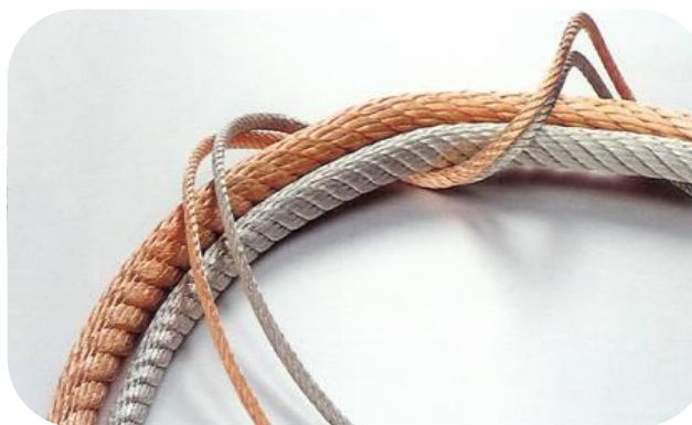
Rund tvinnad lits 0,10mm 2 - 1000mm 2