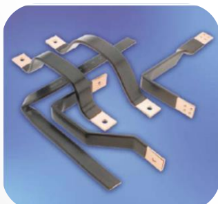
Isolerade flexibla lameller och skenor