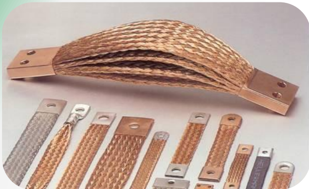
Exempel på flata och runda strömförbindningar