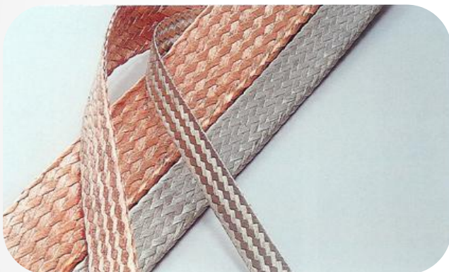
Flat flätad lits 0,16mm 2 - 400mm 2