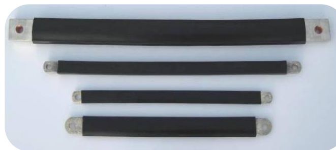
Isolerade flexibla strömförbindningar