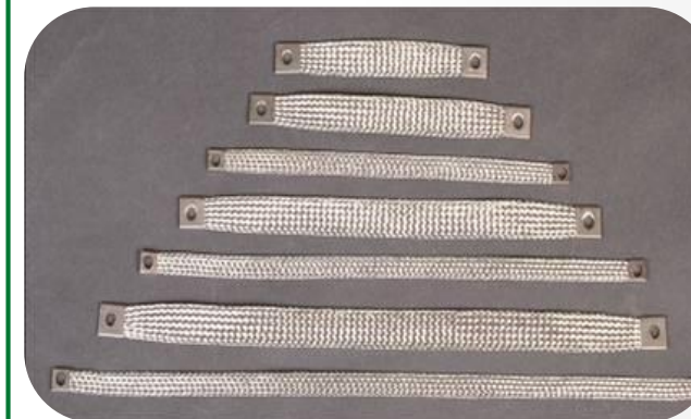
Lagerfört standard stortiment 6-16mm 2