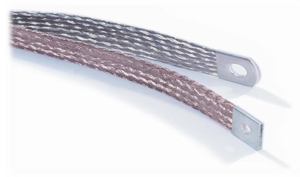
Jordflätor lagerfört i std. sort. 6-16mm 2