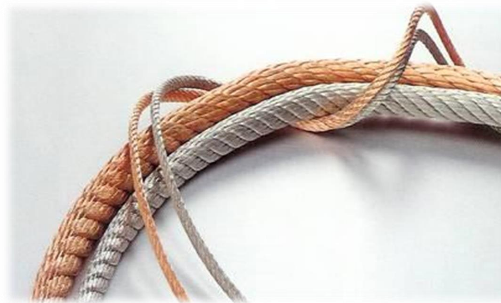
Rund tvinnad lits 0,10mm 2 - 1000mm 2