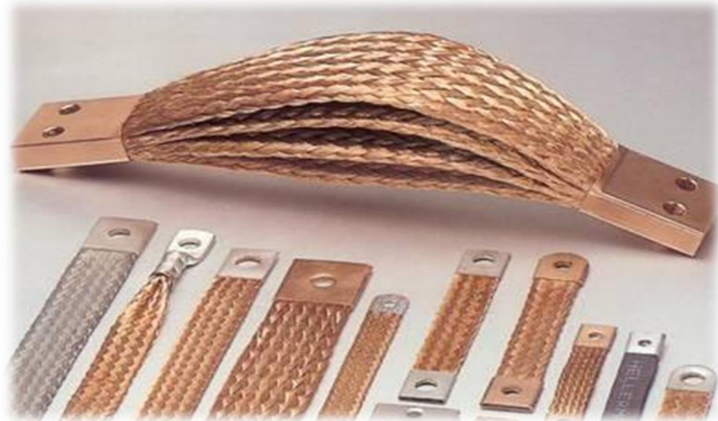
Exempel på flata och runda strömförbindningar